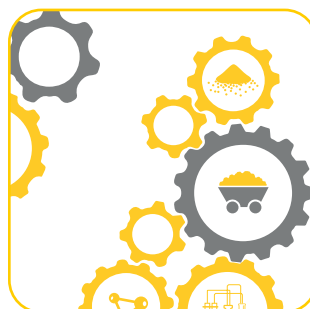
Контроль качества сырья, готовой продукции, производственного процесса